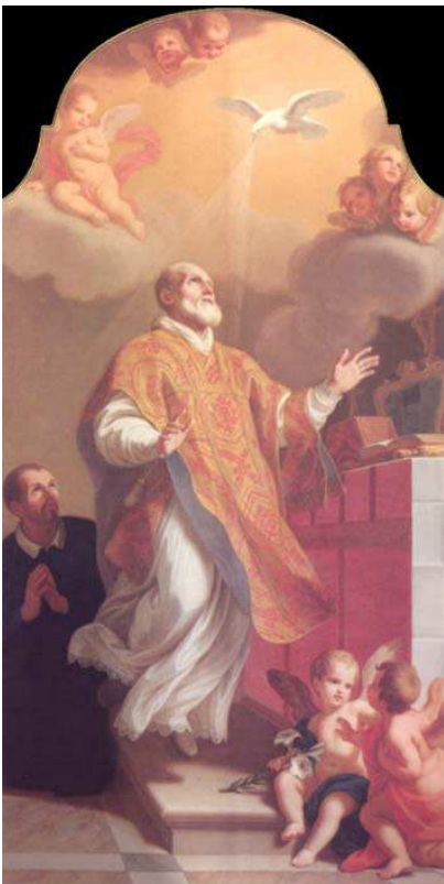
Gaetano Lapis, Estasi di S. Filippo Neri, 1754

Il cuore per gli Ebrei non è come lo intendiamo noi, ma è il sistema di guida emotivo: amare il Signore non a livello razionale, ma passionalmente. Anche noi dobbiamo amare Dio non con la mente, cercando di sapere qualche cosa di più, ma farne l'oggetto del nostro Amore, della nostra passione, entrare in Gesù con tutte le nostre emozioni.